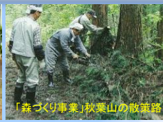
「森づくり事業」秋葉山の散策路