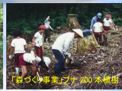
「森づくり事業」ブナ200本植樹