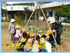
こども園の緑化植樹